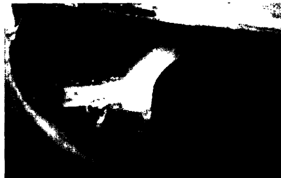
图1 试件受水流冲磨实际工作状态

本次设计了三种含沙水流进行冲磨试验,含沙量分别为 \rho = 0 kg/m 3 、 \rho = 0.5 kg/m 3 、 \rho = 30 kg/m 3 ;选取的试验流速分别为 V = 32 m/s、 V = 25 m/s、 V = 20 m/s;试验结果见表 3。